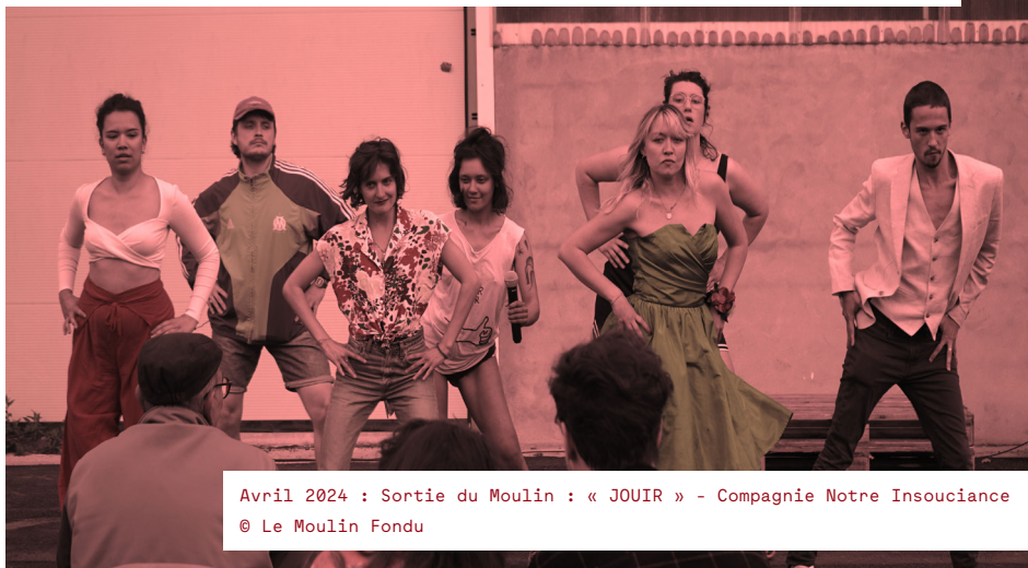
Avril 2024 : Sortie du Moulin : « JOUIR » - Compagnie Notre Insouciance